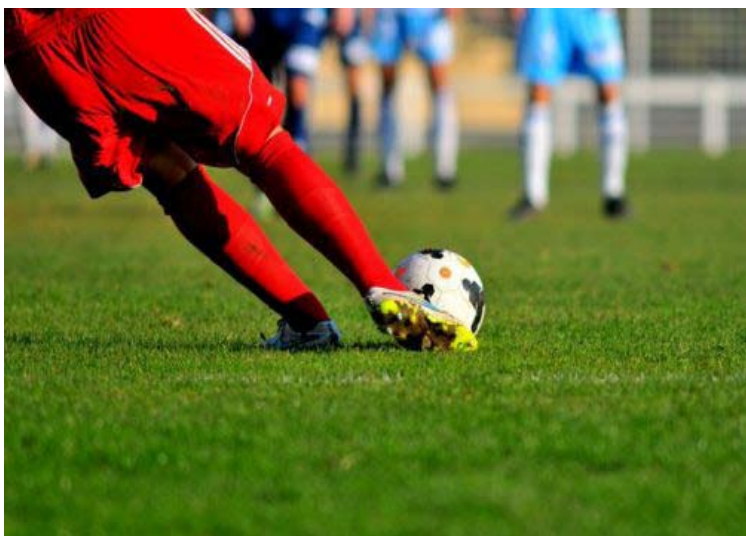
Accessions – Rétrogradations Seniors SAISON 2018/2019

Rappel : Le passage du championnat Départemental 3 (D3) à 48 équipes à partir de la saison 2019/2020 au lieu de 60 a été approuvé à l'unanimité des clubs présents lors de l'Assemblée Générale du 16 juin 2018.