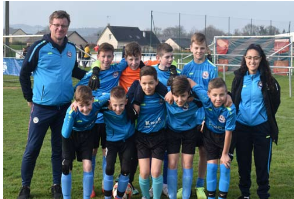
L'équipe de NORD ARDENNES