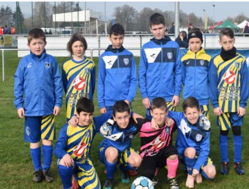
L'équipe des AYVELLES