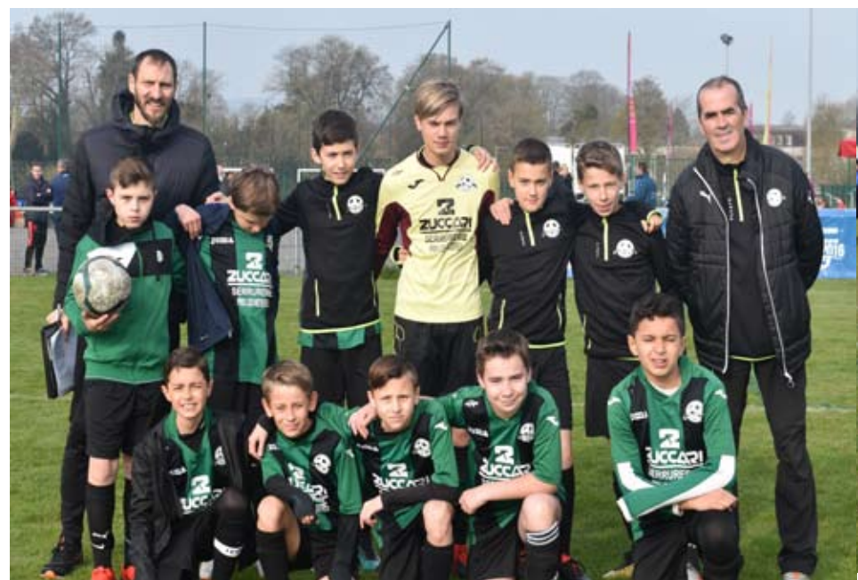
L'équipe de PRIX LES MEZIERES