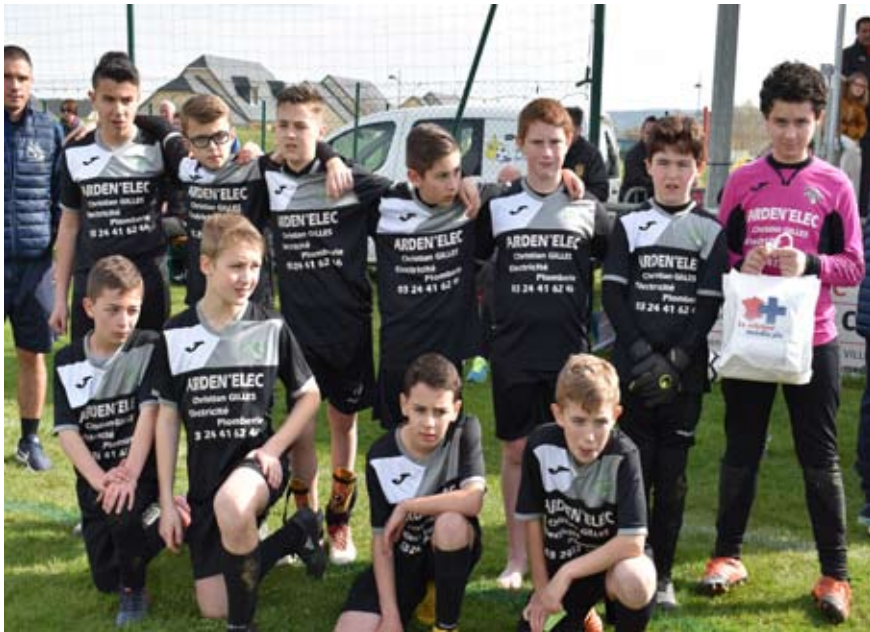
L'équipe de HAYBES/FUMAY