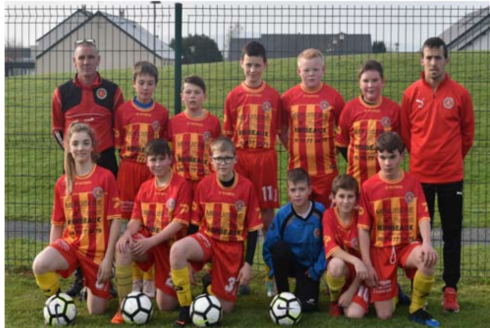
L'équipe d'AUVILLERS SIGNY LE PETIT