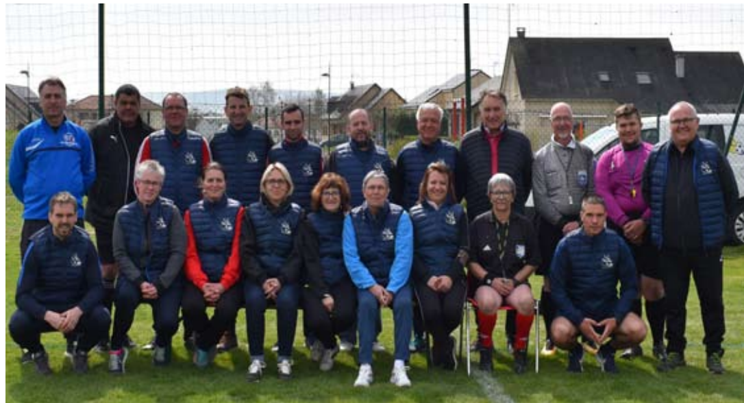
L'équipe du District des Ardennes de Football qui a officié durant toute cette journée (membres de Commission, techniciens, arbitres, élus)