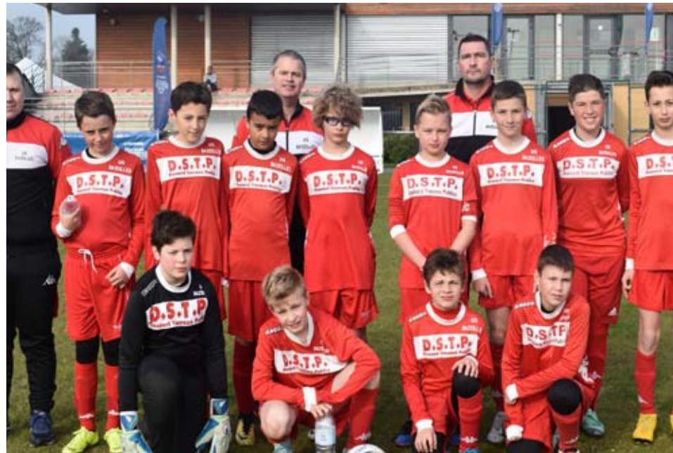
L'équipe de BAZEILLES