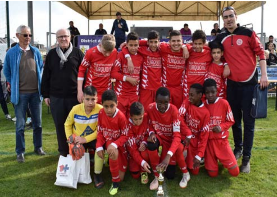
L'équipe de l'ENTENTE SPORTIVE DE CHARLEVILLE