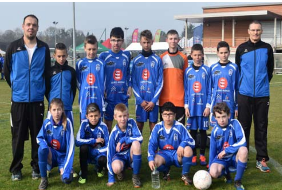
L'équipe de VIVAROIS