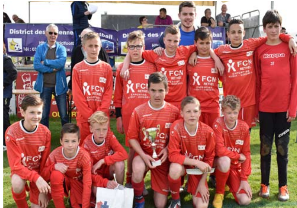
L'équipe de RETHEL