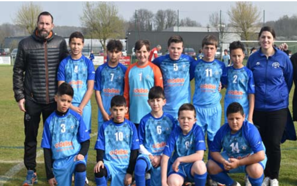
L'équipe de SEDAN TORCY