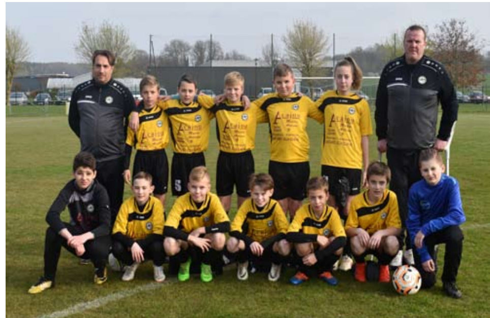
L'équipe de l'AS TRMA