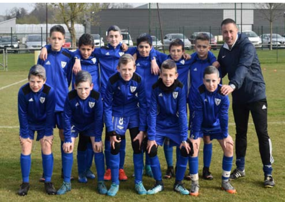
L'équipe de BALAN