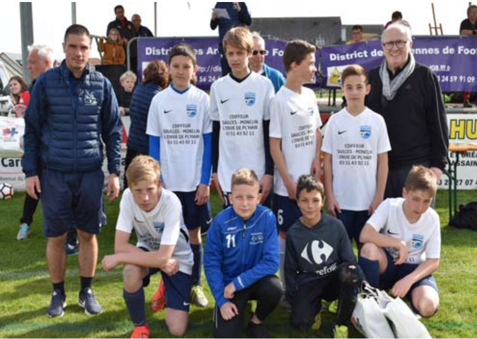
L'équipe de SAULCES MONCLIN