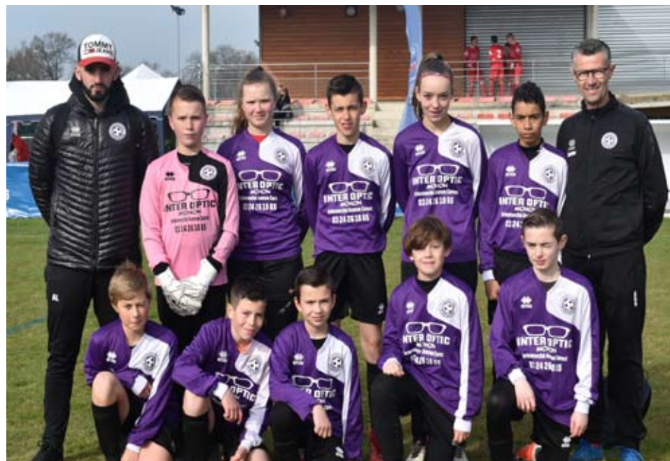
L'équipe de VILLERS SEMEUSE