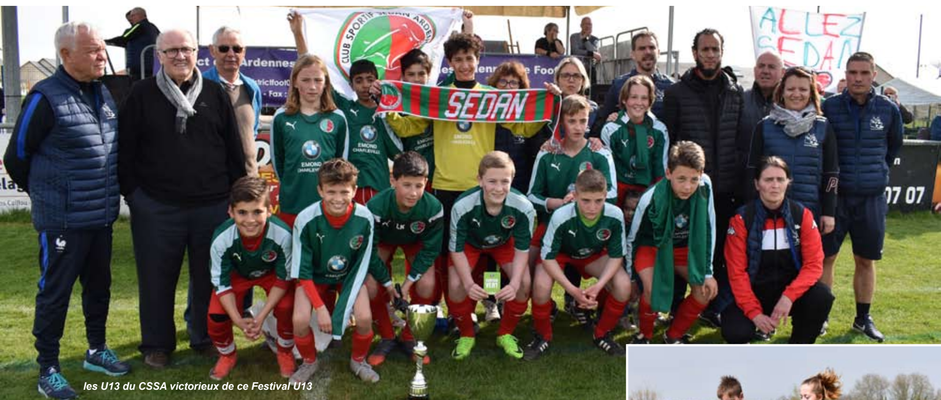
les U13 du CSSA victorieux de ce Festival U13

Samedi 6 avril 2019 s'est déroulée, sur les terrains en herbe de l'US BAZEILLES, la Finale Départementale du « Festival Foot U13 ».