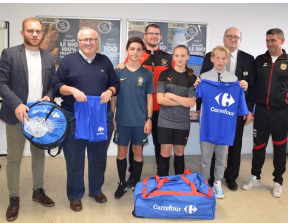
Les U13 de la JOYEUSE DE WARCQ