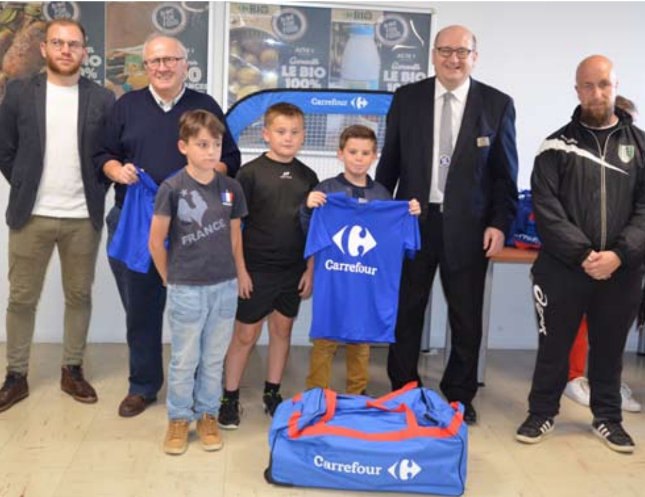
Les U11 du FC FLOING