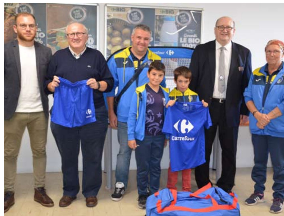
Les U13 de LES AYVELLES