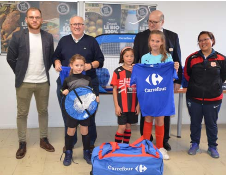
Les U11 de l'US FLIZE

Chaque dotation comprenait chasubles, sacs, chaussettes, mini buts, maillots, shorts, plots et tee-shirts «Fiers d'être bleus». Un grand merci au magasin Carrefour de Charleville-Mézières pour tout ce matériel remis aux clubs, qui en ont toujours grand besoin.