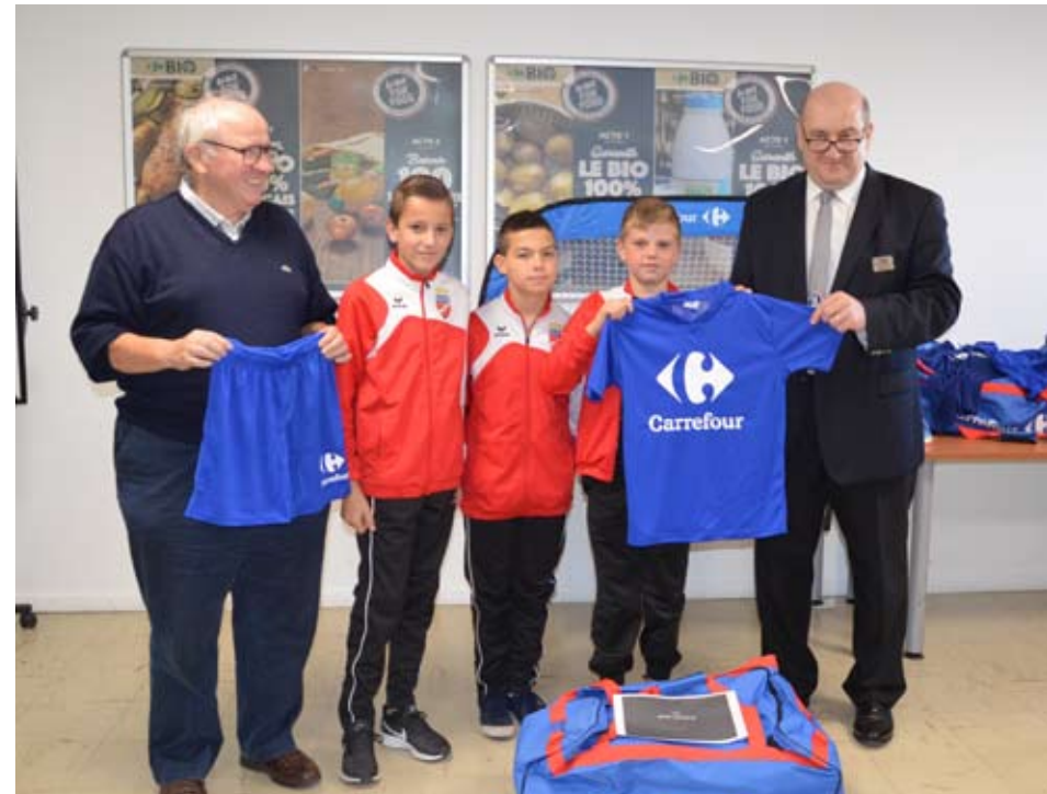
Les U13 du FC BOGNY