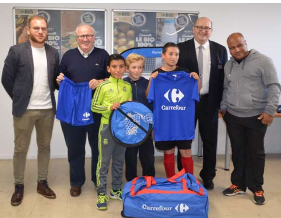
Les U13 de l'US REVIN