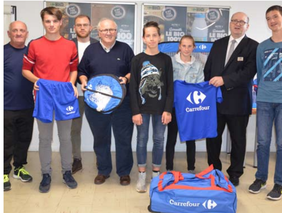
Les U17 d'AUVILLERS SIGNY LE PETIT