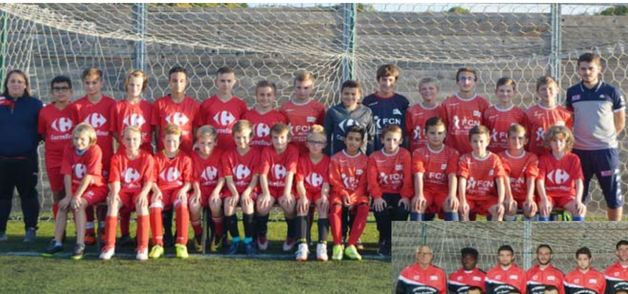
Le RSF remercie la société «Aux serres de Barby» pour ces superbes sweats, et remercie l'hypermarché «Carrefour» de Rethel pour ces beaux maillots à destination de nos U13.