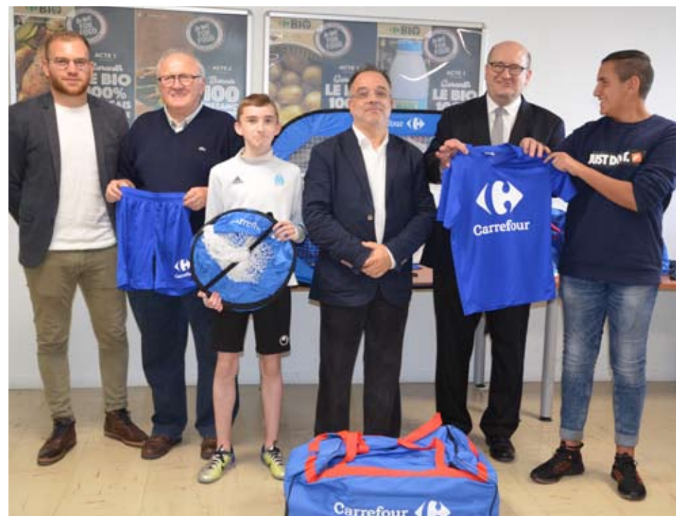
Les U17 de l'ENTENTE SPORTIVE DE CHARLEVILLE