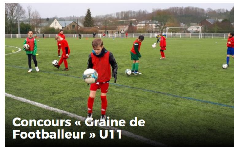
Concours « Graine de Footballeur » U11

ACCUEIL DISTRICT COMPÉTITIONS PRATIQUES FORMATIONS TECHNIQUE ARBITRAGE CLUBS MÉDIAS DOCUMENTS